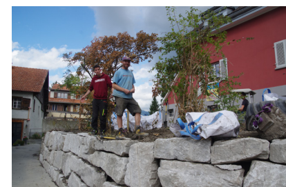
auf der Mauer in Zizers