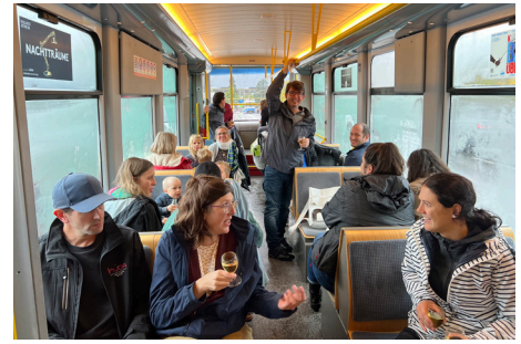
Stadtrundfahrt im Cobra-Tram