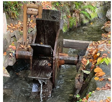
Walschelle am Rablander Waal