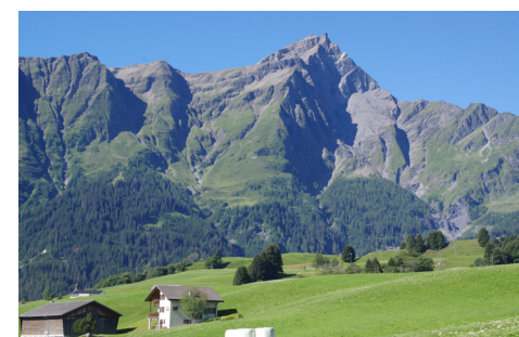
Piz Beverin vom Heinzenberg gesehen