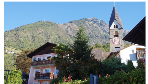
Alte Kirche Algund