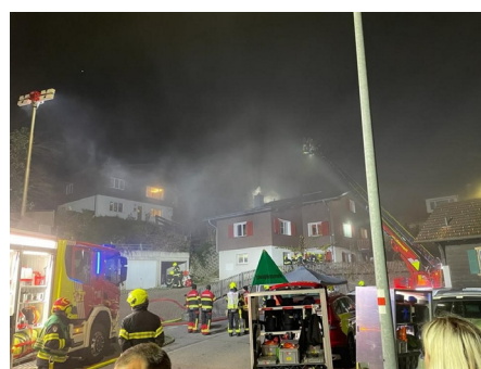
Es brennt in Araschgen!