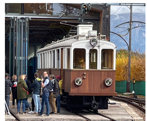
Rittner Bahn, historischer Triebwagen