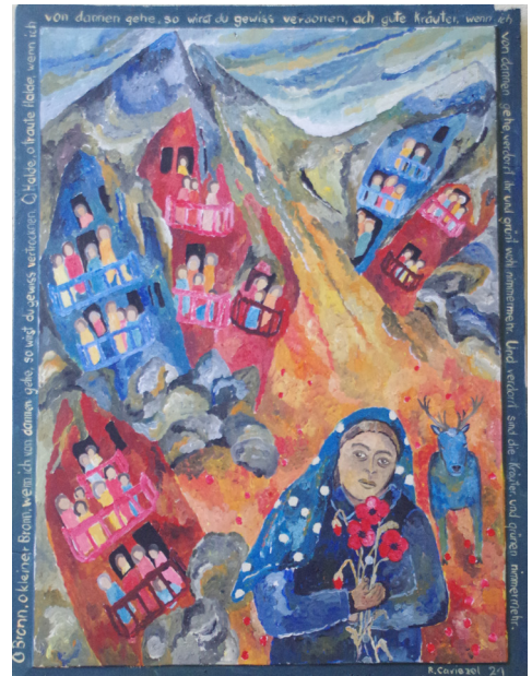
Ausstellung Urmein: Regula Caviezel