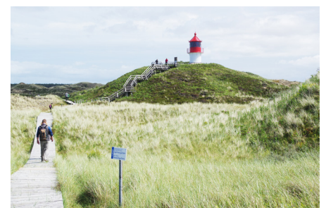
Quermarkenfeuer und Bohlenweg