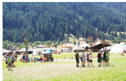
Bula Mova 2022 Goms