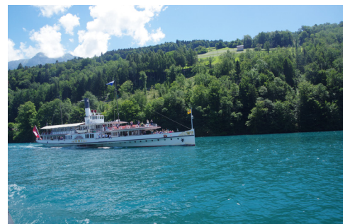
Am Geburtstag auf dem Vierwaldstättersee