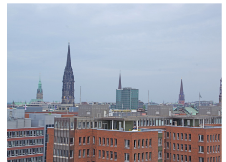
Blick auf Hamburg