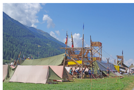
Bula Mova 2022 Goms