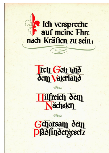
Das traditionelle (Schweizer) Pfadinderversprechen